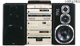
システムリモコン シャンペンゴールドタイプ