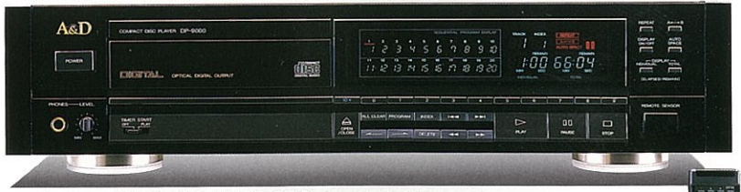
CDプレイヤー DP-9000 ¥158,000 (ワイヤレスリモコン付属)

シャーシ、側板取付部、メカニズム取付部をハニカム構造アルミダイキャスト一体成型とした上で、3.2mm厚の銅メッキ剛天板、18mm厚スターウッド側板、セラミック・ベダスタルを採用するなど、高剛性コンストラクションを徹底。A/D独立強力電源部、A/D完全分離シールド設計、先進の光伝送、そして4倍オーバーサンプリング・デジタルフィルターの採用とあいまって至純のデジタル再生を実現します。