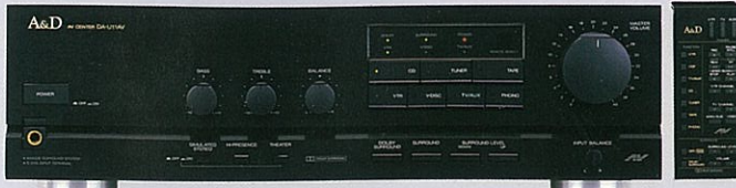
AVセンター DA-U11AV ¥74,800 (ワイヤレスリモコン付)

AVの新たな中枢。オーディオ4系統、映像機器3系統、計7系統が接続可能。オーディオ、ビデオ両面を文字通り自在にコントロールできるシステムの誕生です。S-VHS対応端子装備、ドルビーサラウンド、ハイプレゼンス、シアター、シミュレーター、ステレオの4ポジション・サラウンド機能、フロント/リア独立4ch大出力パワーアンプの搭載により、劇場さながらの臨場感と豊かな映像再生を実現します。