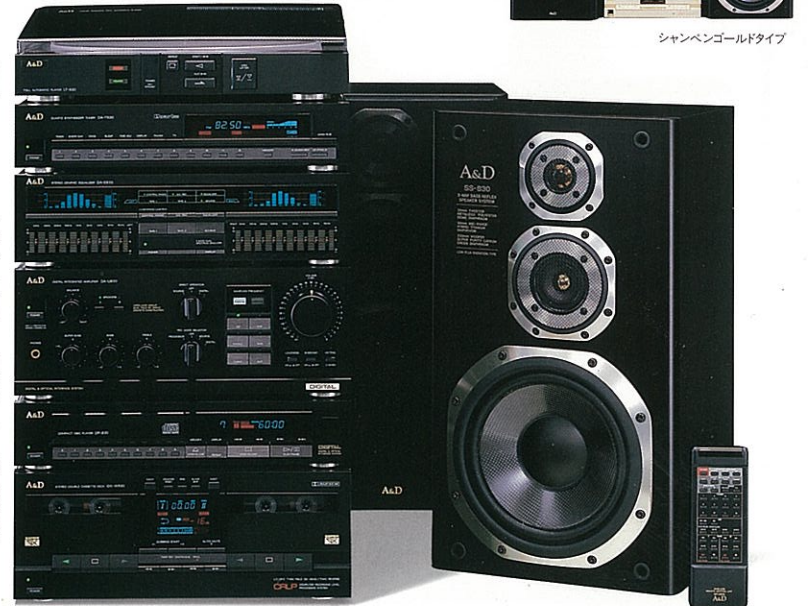
システムリモコン

●システムリモコン標準装備 ※一体価格商品は、単品での販売はいたしません。 ※写真は、オプションを加えたシステム・アップの一例です。