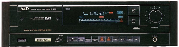
DATデッキ D-930-BK/GD ¥178,000 (ワイヤレスリモコン付属)

GX COMPOのシステムアップ用に設計されたモデルですが、その実力はまさにD-9000ゆずり。徹底した剛性設計による不要振動の排除、デジタル/アナログ・セパレート構造をふまえ、4倍オーバーサンプリング・デジタルフィルター採用の再生系、L,R独立D/Aコンバーターの装備により、音の細部まで高精度な記録再生を実現。カラーバリエーションはブラックの他、シャンペンゴールドも用意しました。