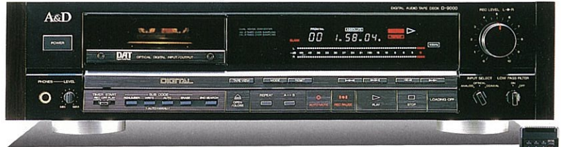
DATデッキ D-9000 ¥200,000 (ワイヤレスリモコン付属)

2倍オーバーサンプリング・デジタルフィルターとL,R独立D/Aコンバーター採用の録音系、4倍オーバーサンプリング・デジタルフィルターとL,R独立グリッチレス高速D/Aコンバーターを採用した再生系、そして光伝送による入出力システムにより音質を妥協なく追求。高剛性構造シャーシとデジタル/アナログ完全セパレート構造に基づき、きめ細やかでナチュラルなサウンドは他の追随を許しません。