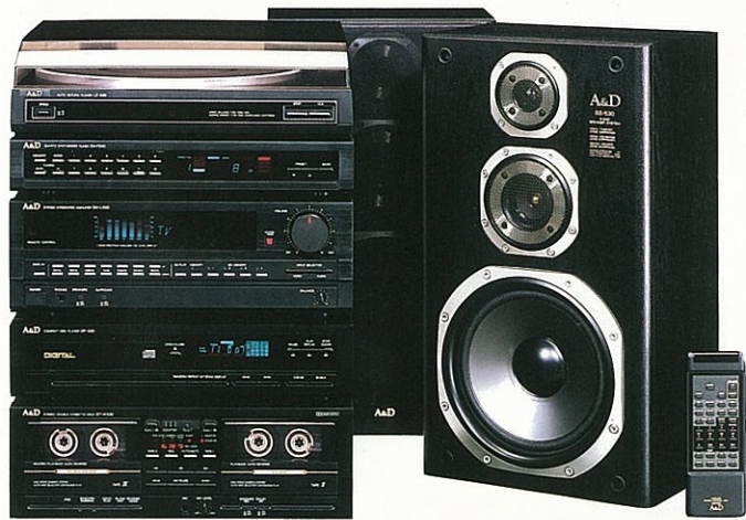
システムリモコン