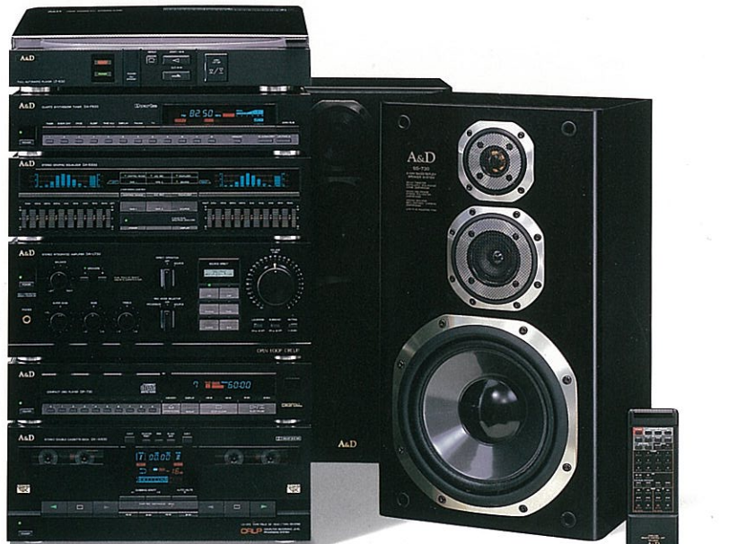
システムリモコン

●システムリモコン標準装備 ※一体価格商品は、単品での販売はいたしません。 ※写真は、オプションを加えたシステム・アップの一例です。