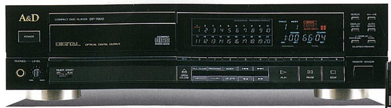
CDプレイヤー DP-7000 ¥89,800 (ワイヤレスリモコン付属)

DP-9000の開発思想を受け継ぎ、シャーシ構造、ピックアップ・メカニズム部の無共振・高剛性化を徹底、細やかで豊かなサウンドを実現する4倍オーバーサンプリング・デジタルフィルターの採用、完全なA/D分離コンストラクション、光伝送システムなど音の純度を最重視した設計により、CDポテンシャルをしなやかに、高精度に引き出すハイコストパフォーマンス機です。