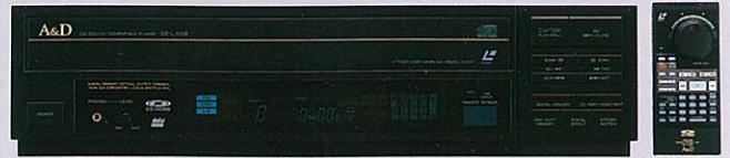
LD/CD/CDVフルコンパクトプレーヤー DP-L1000 ¥158,000 (ワイヤレスリモコン付)

AVの新たな主役。レーザーディスク、CD、CDVが一台で楽しめるコンパクトプレーヤー。A&Dならではの剛性設計を基に、新設計の高性能小型ピックアップの採用などにより高い信号読み取り精度を獲得、水平解像度420本以上、映像SN比46dB以上のスペックとあいまってAV新時代に対応しています。また、8ビットデジタルメモリー回路搭載によりリックプレイも自由自在。いい音でいい画質が楽しめます。